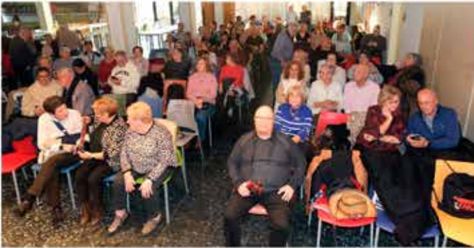
25-11-25 Balls en línia i country