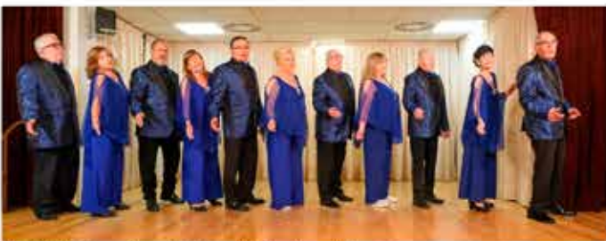
11-11-25 CasaXou, Festes de Tardor al Casal