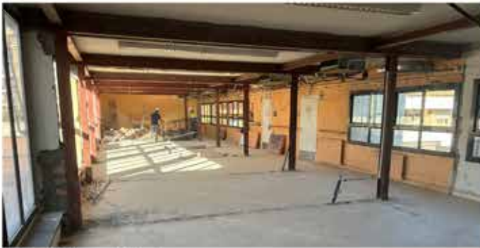
10-11-25 Obres al Casal