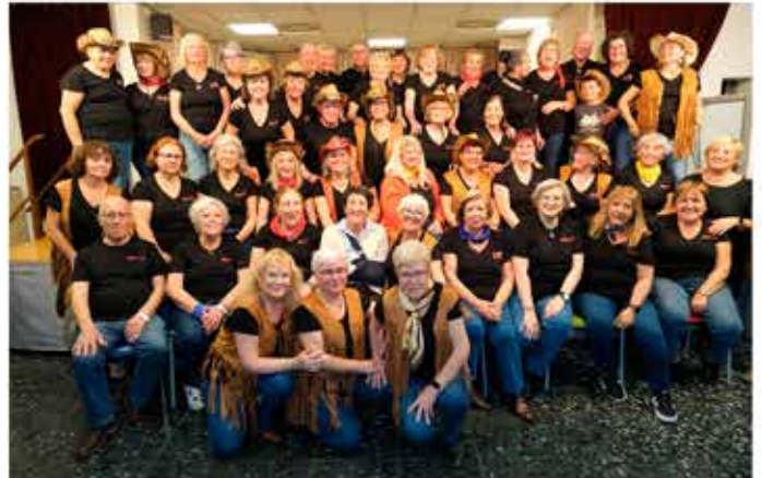
25-11-25 Balls en línia i country