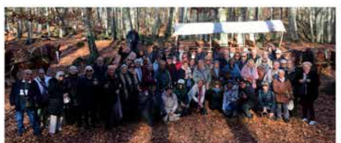
28-11-25 Visita a la Fageda d'en Jordà, a la Garrotxa