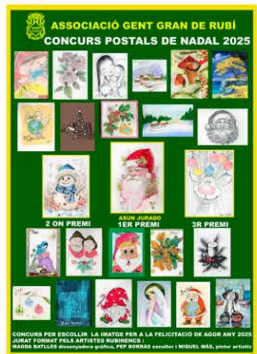
22-11-25 Cartell postals Nadal