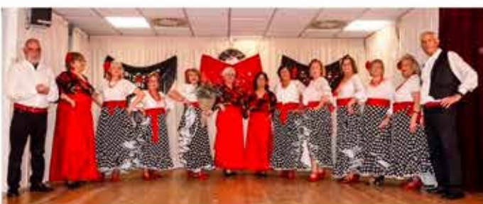
27-11-25 Grup de sevillanes al Casal