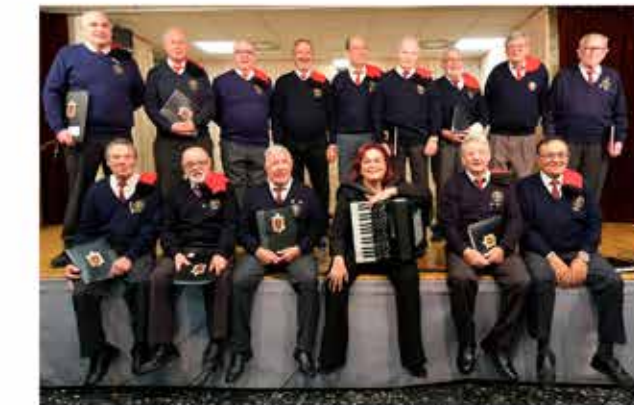
19-11-25 Unió Coral, Festes de Tardor al Casal