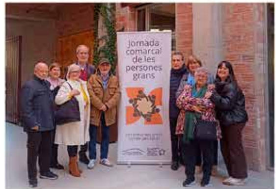
26-11-25 Primera jornada de Gent Gran a Terrassa