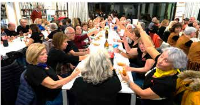
25-11-25 Balls en línia i country