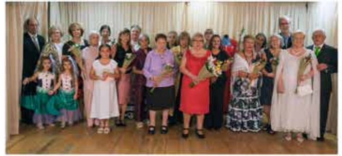
05-11-25 Desfilada de models