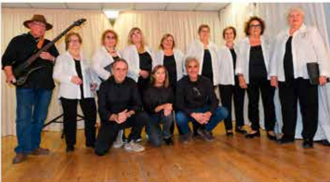
19-11-25 La Rondalla, Festes de Tardor al Casal