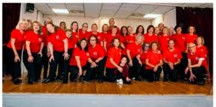
27-11-25 Grup de balls llatins al Casal