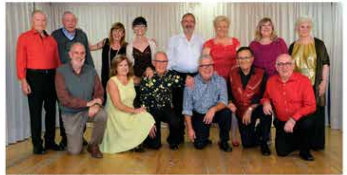
11-11-25 Festes de Tardor al Casal