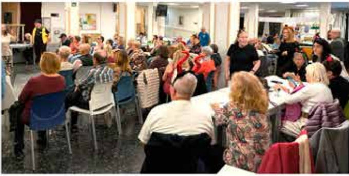
31-10-25 Karaoke castanyada