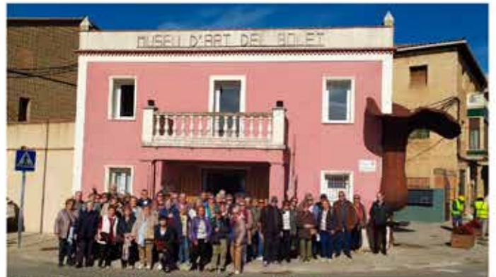
12-11-25 Sortida a Montmajor i Museu del Bolet