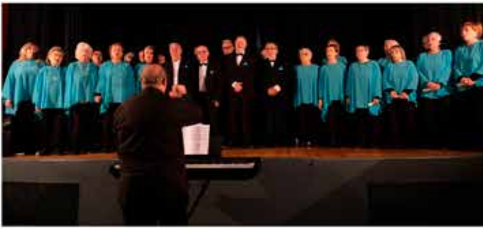
22-11-25 Coral Josep Rusiñol per Sta. Cecília