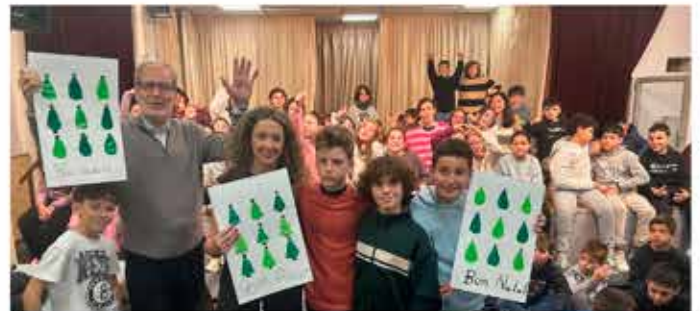
19-12-25 Nadales dels nens de 5è de primaria dels Maristes