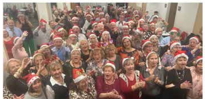
21-12-25 Ball de diumenges amb gorro de Pare Noel