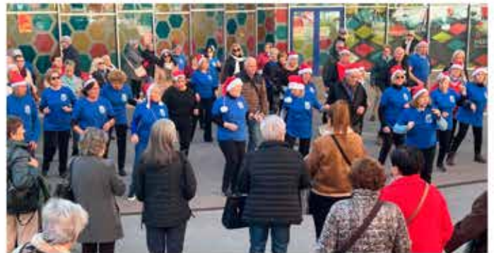
12-12-25 Balls en línia a la plaça del mercat