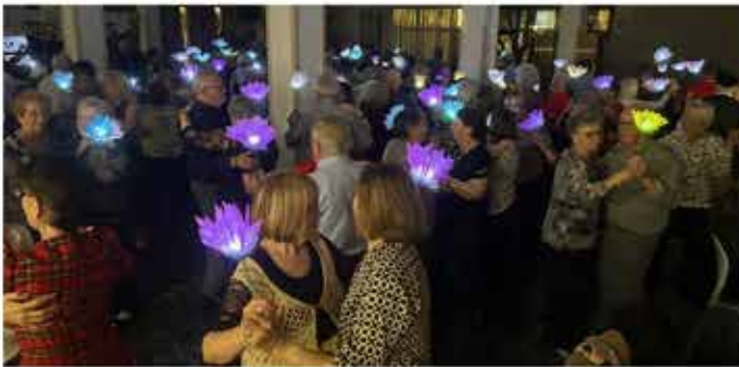
07-12-25 Ball del Fanalet