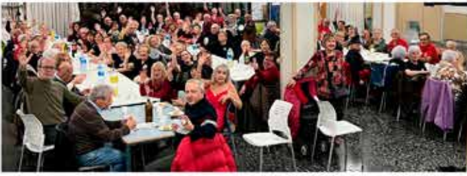
03-12-25 Beremar de germanor