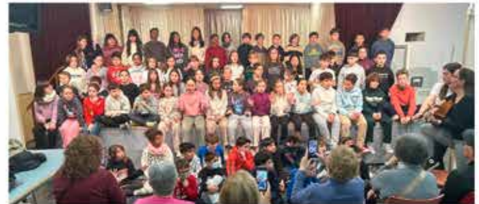
19-12-25 Els nens dels Maristes canten Nadales al Casal