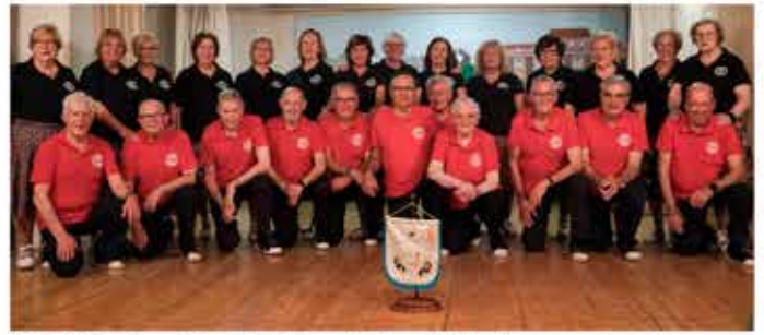
03-12-25 Grup de Sardanistes - Festes de Tardor