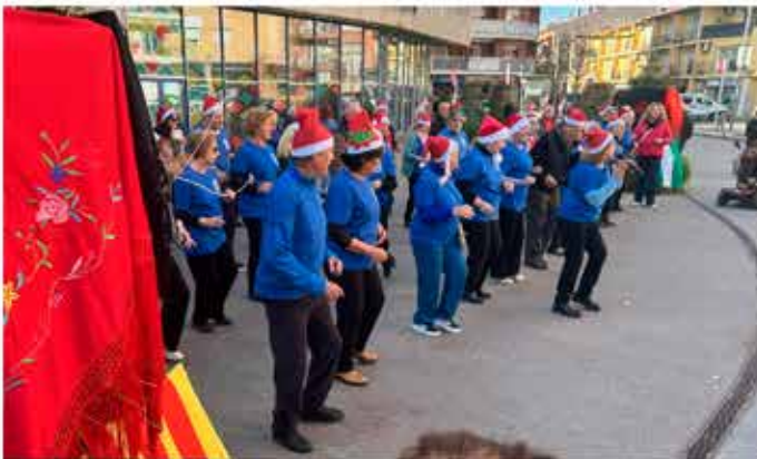
12-12-25 Balls en línia a la plaça del mercat