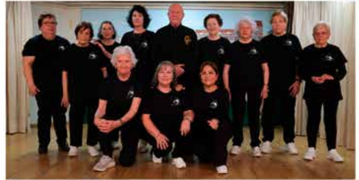
03-12-25 Grup de Tai-Txi - Festes de Tardor