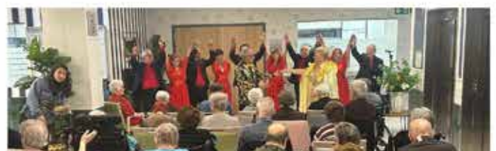
09-01-26 CasalXou a la Residència d'Ancians Vitalia, a Rubí