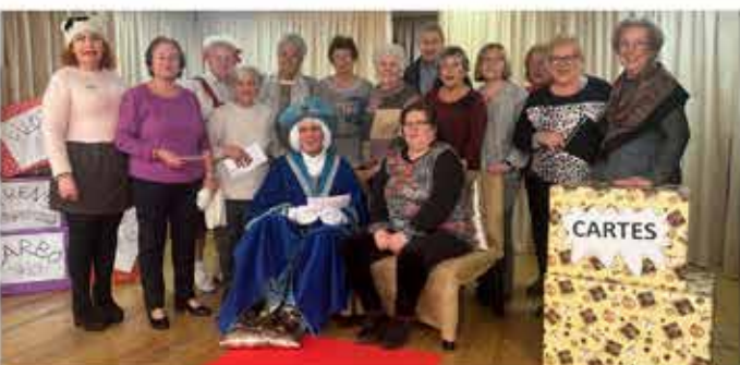
02-01-26 Patge Reial 2026, al Casal