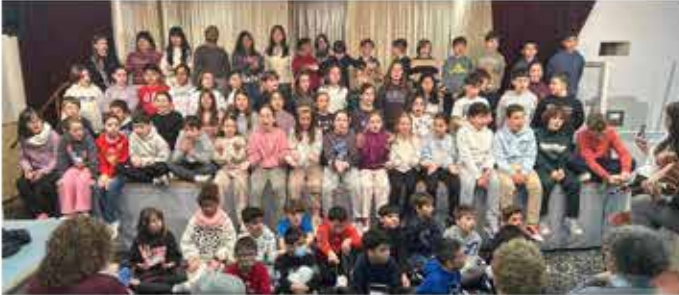
19-12-25 Els nens dels Maristes canten Nadales al Casal