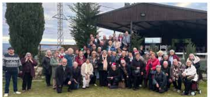
13-12-25 Prenadal a Prats de Lluçanès