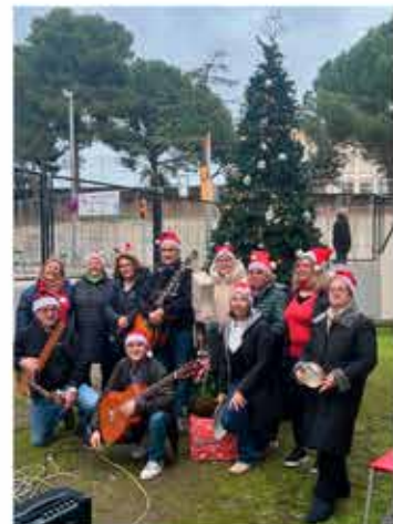
19-12-25 La Rondalla al voltant del arbre de Nadal