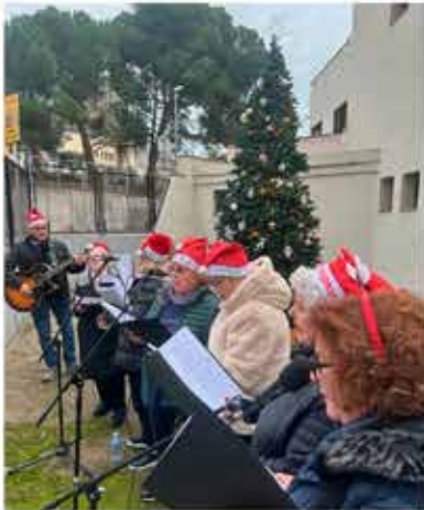
19-12-25 Nadales al voltant del arbre de Nadal