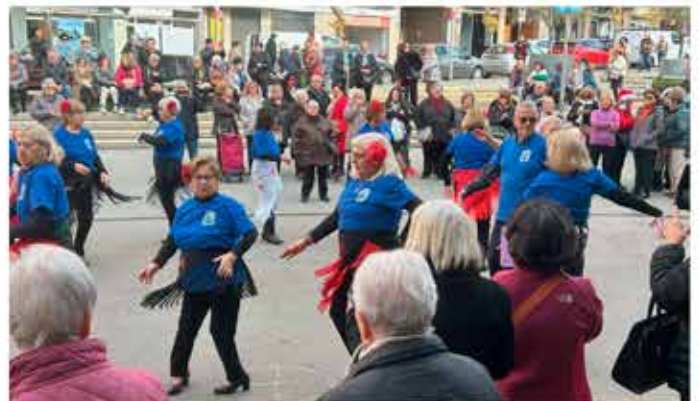
12-12-25 Sevillanes a la plaça del mercat