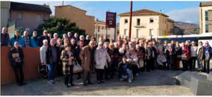
17-12-25 Visita a l'espai Cràter, a Olot