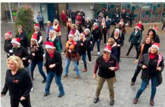
16-12-25 Balls en línia i country a la plaça del mercat