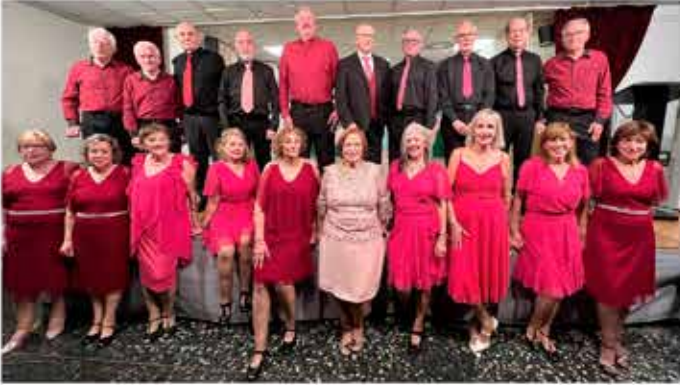
03-12-25 Grup de Balls de Saló - Festes de Tardor